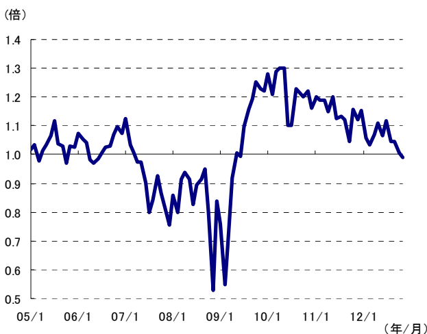
米国リートのNAV倍率の推移 (2005年1月～2012年10月、月次)