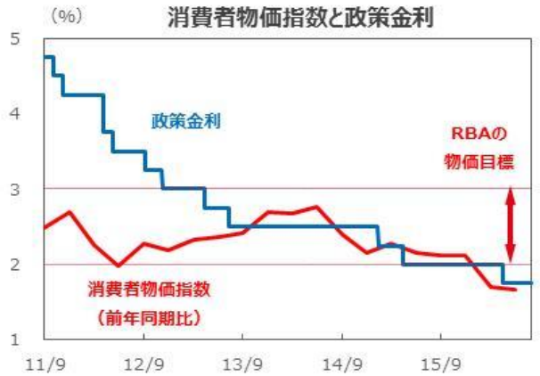
(注) 消費者物価指数はトリム平均値。データの期間は2011年7-9月期~2016年4-6月期。政策金利は2011年9月30日~2016年8月18日。