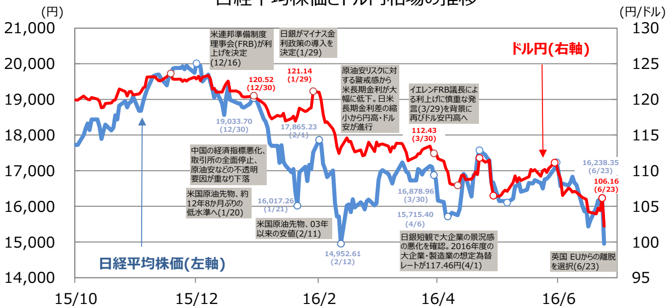
日経平均株価とドル円相場の推移

(注)データ期間は2015年10月1日から2016年6月24日。